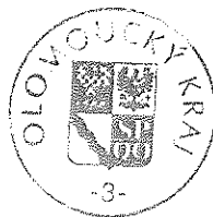
Ing. Zdeněk Švec náměstek hejtmána Olomouckého kraje